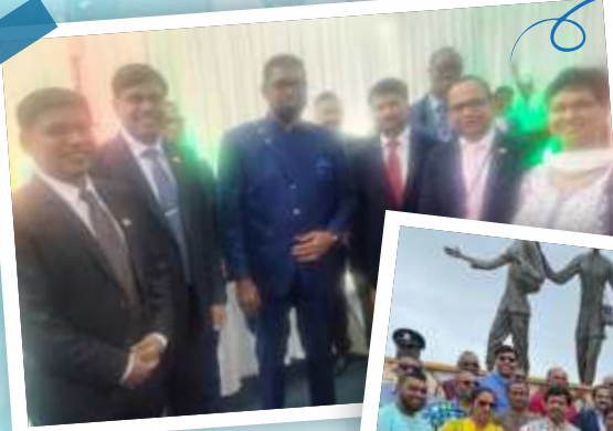
Visit of Indian Delegation to Berbice, Guyana on 23/04/2023