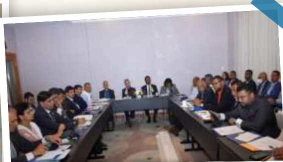
Joint Commission Meet on 22/04/2023 co-chaired by Hon'ble EAM India & Hon'ble EAM, Guyana