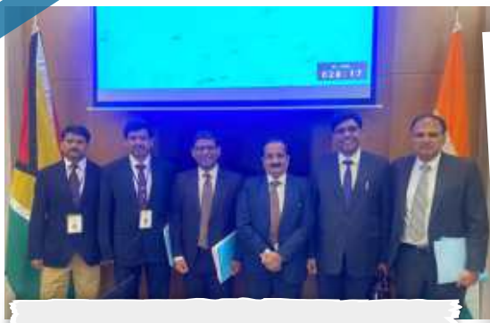
Indian Delegation at Joint Commission meet on 22/04/2023