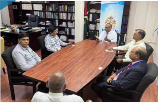
Meeting with Hon'ble Health Minister Guyana and Advisors on 21/04/2023 at Georgetown