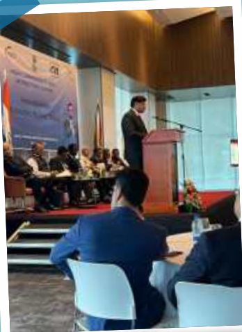
Presentation on PMBJP on 22/04/2023 at Business Meet, Georgetown